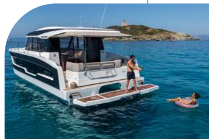
Hydraulic platform Passerelle hydraulique